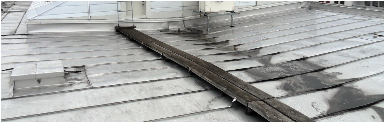
Fig. 3.63. Invändig avvattning kan anses vara en olämplig lösning men kanske nödvändig med hänsyn till omständigheterna?